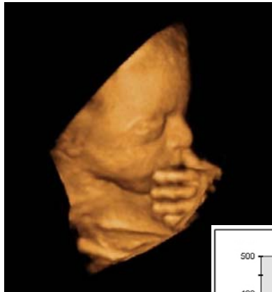
Figure 1. L'utilisation d'un format en italique permet de bien faire la différence entre texte et légende de figures / image

Si vous souhaitez utiliser une vidéo, nous souhaitons que vous la soumettiez séparément et non pas déjà incluse dans le poster